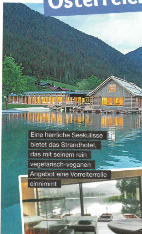
Eine herrliche Seekulisse bietet das Strandhotel, das mit seinem rein vegetarisch-veganen Angebot eine Vorreiterrolle einnimmt