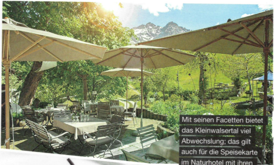
Mit seinen Facetten bietet das Kleinwalsertal viel Abwechslung; das gilt auch für die Speisekarte im Naturhotel mit ihren pflanzlichen Optionen

Hier wird wirklich alles frisch aus 100-prozentigen Bioprodukten zubereitet; sogar das Mehl wird selbst gemahlen, um damit fast täglich frisches Brot zu backen. Vegane Optionen gibt es schon morgens am Frühstücksbüffet, bei einer Tasse fair gehandeltem Bio-Kaffee, reichlich: vom Frischkornbrei über die Gemüse- und Obststation bis zur Ayurveda-Ecke mit warmen Kompotts. Auch mittags, nachmittags und abends gibt es vegane Optionen. Nachhaltigkeit ist im ganzen Haus wichtig: Von den rein ökologischen Reinigungsmitteln über die Warmwasseraufbereitung bis zu Lehmwänden, die die Klimaanlage sparen. Naturhotel Chesa Valisa, Gerbeweg 18, A-6992 Hirschegg, www.naturhotel.at